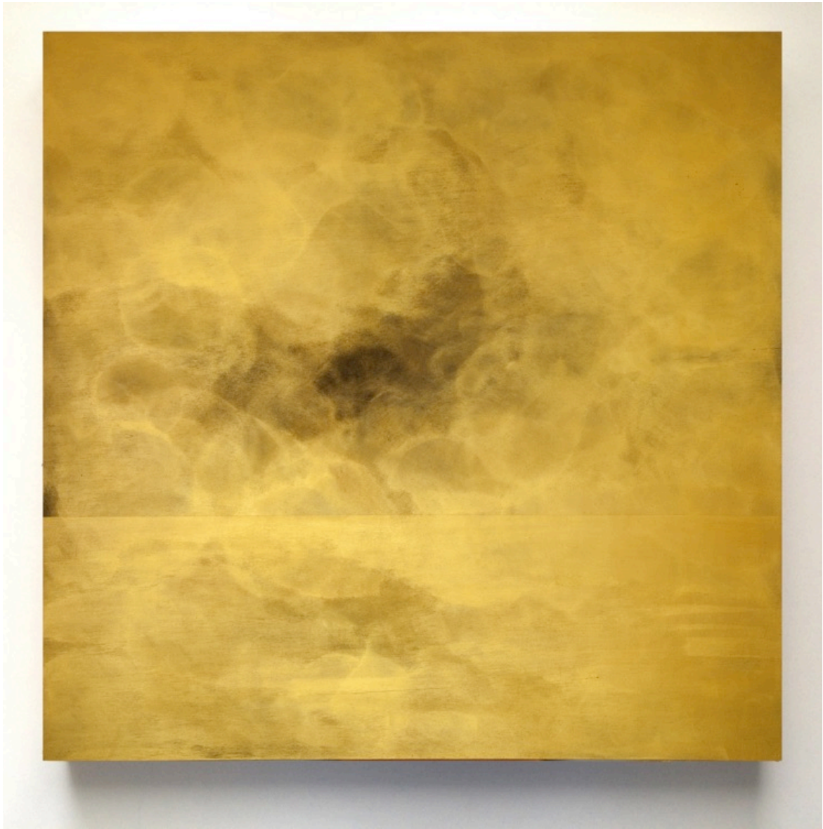
Seascape 57 (2017). 120x120 cm. Acrílico y pigmento sobre tabla de madera.