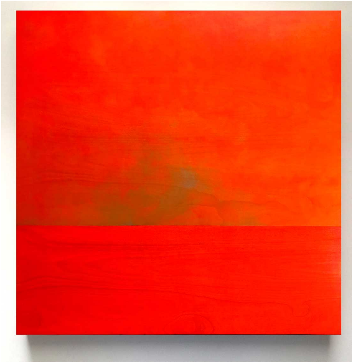
Seascape 92 (2017), 180x180 cm. Acrílico y pigmento sobre tabla de madera.