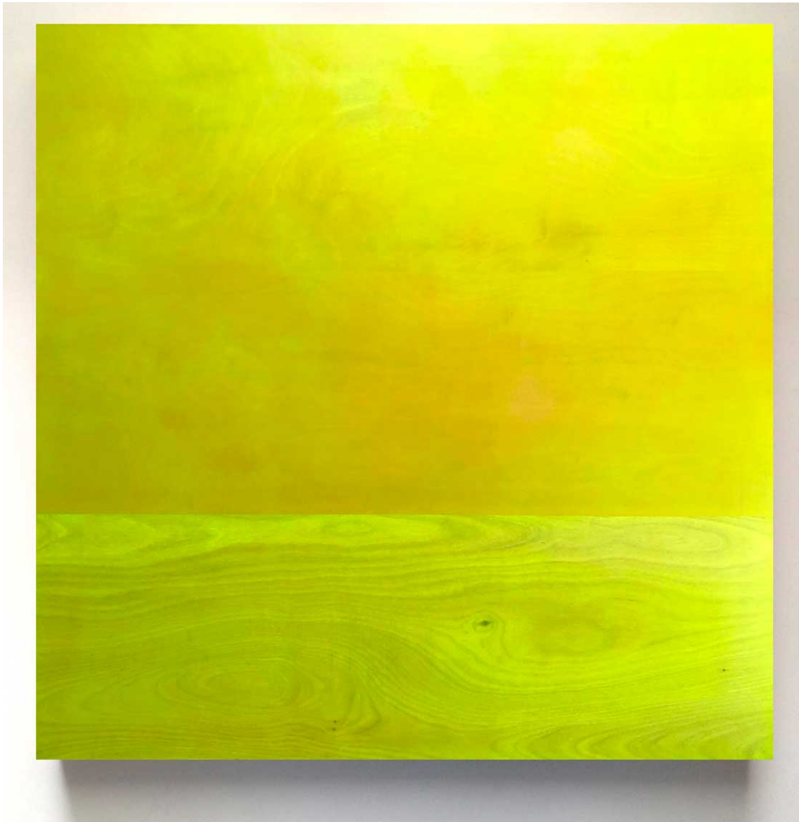
Seascape 95 (2017), 180x180 cm. Acrílico y pigmento sobre tabla de madera.