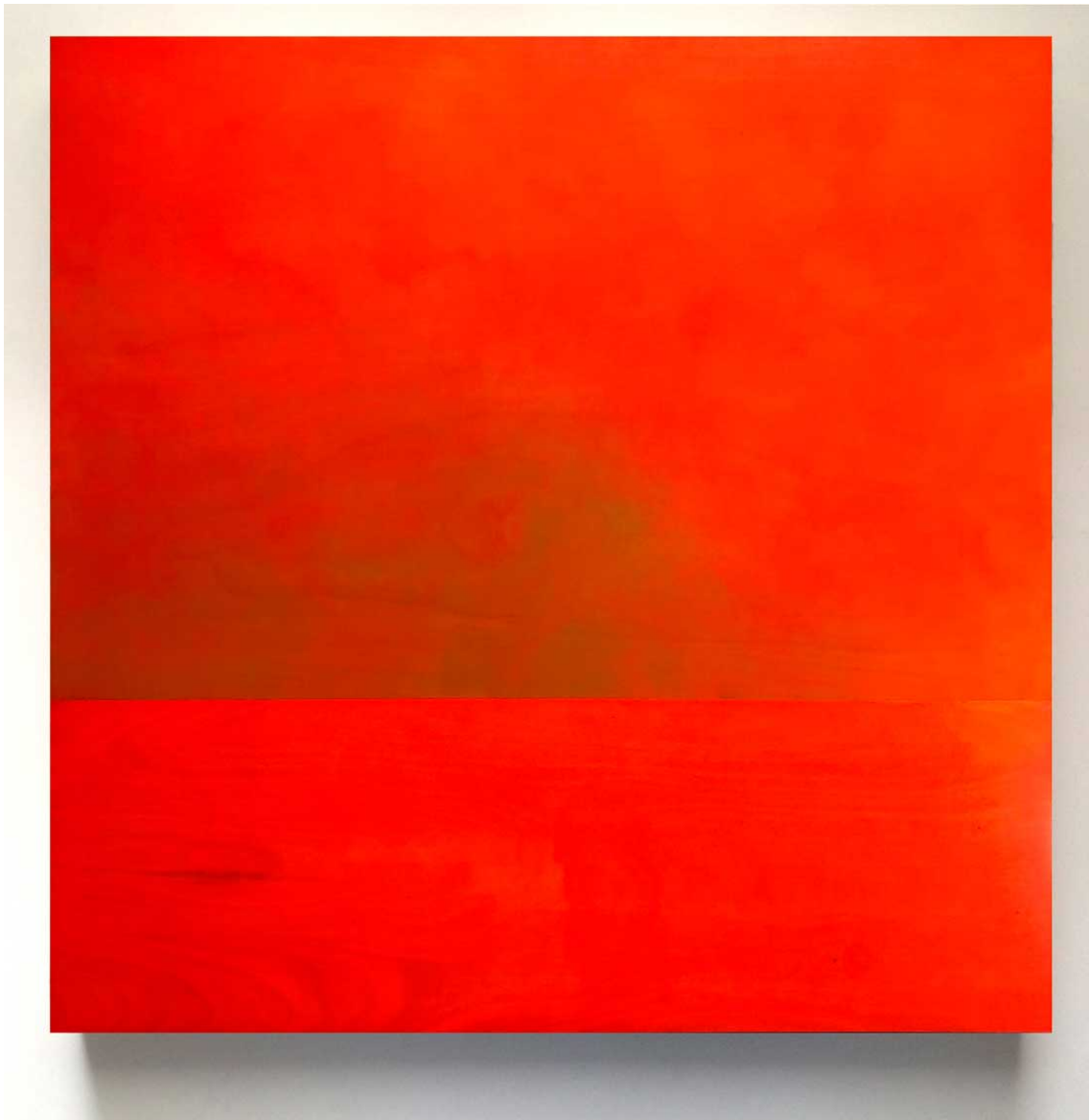
Seascape 91 (2017), 180x180 cm. Acrílico y pigmento sobre tabla de madera.

Seascapes propone un momento de intimidad, introspección y reparación personal.